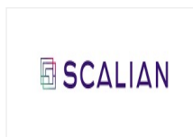
Scalian (ex Eurogiciel)